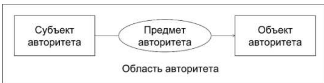
Рисунок 1. Коммуникативная структура авторитета