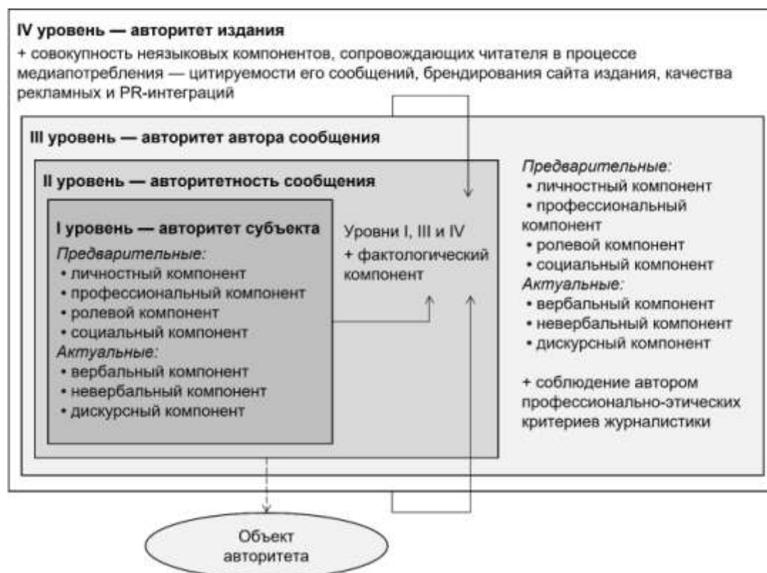
Рисунок 3. Компонентная структура авторитетности новостного сообщения

На рисунке 3 представлена схема компонентной структуры авторитетности новостного сообщения.